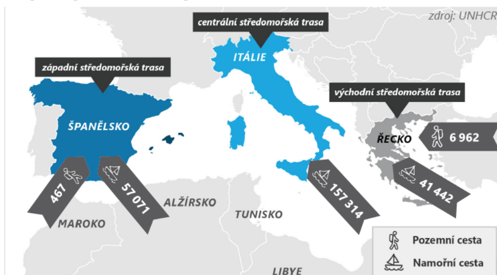
Nelegální migrace na hlavních migračních trasách za rok 2023* (k 31. 12.)

Z pravidelné souhrnné zprávy Ministerstva vnitra o migraci za IV. čtvrtletí 24 roku 2023 vyplývá, že ve čtvrtém čtvrtletí roku 2023 přicestovalo do Evropy přes Středomoří (Španělsko, Itálie, Řecko, Malta a Kypr) nelegálně celkem 71 561 migrantů, z toho 69 948 po moři a 1 613 po zemi. Oproti stejnému období v roce 2022 vzrostly příjezdy do Evropy o 47 %. Mezičtvrtletně pak příjezdy poklesly o 32 %.